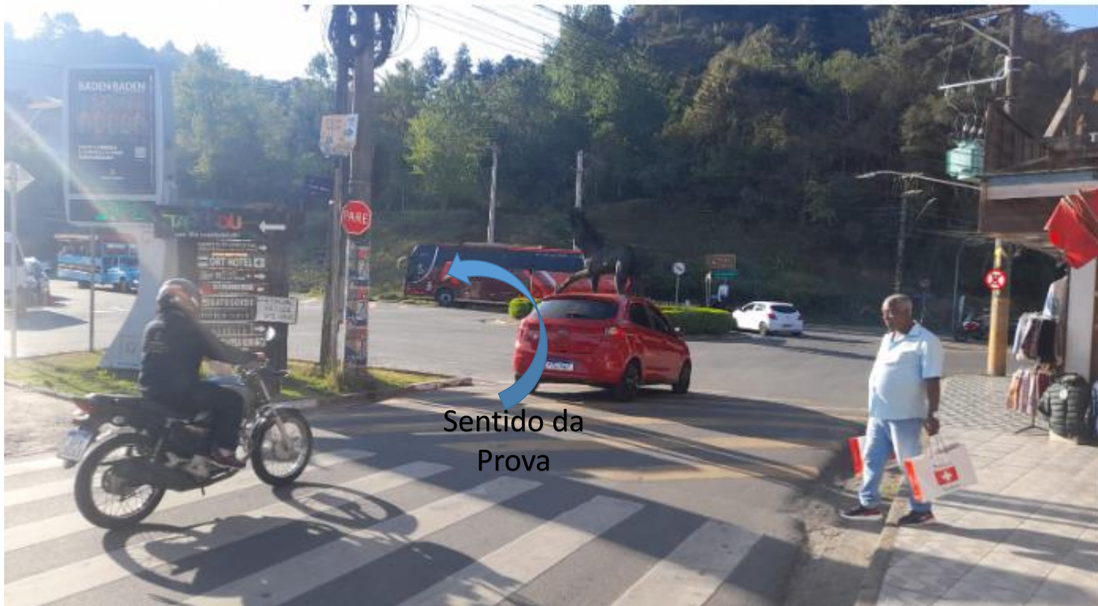
Bifurcação 13: Rotatória do Cavalo – PONTO CRÍTICO