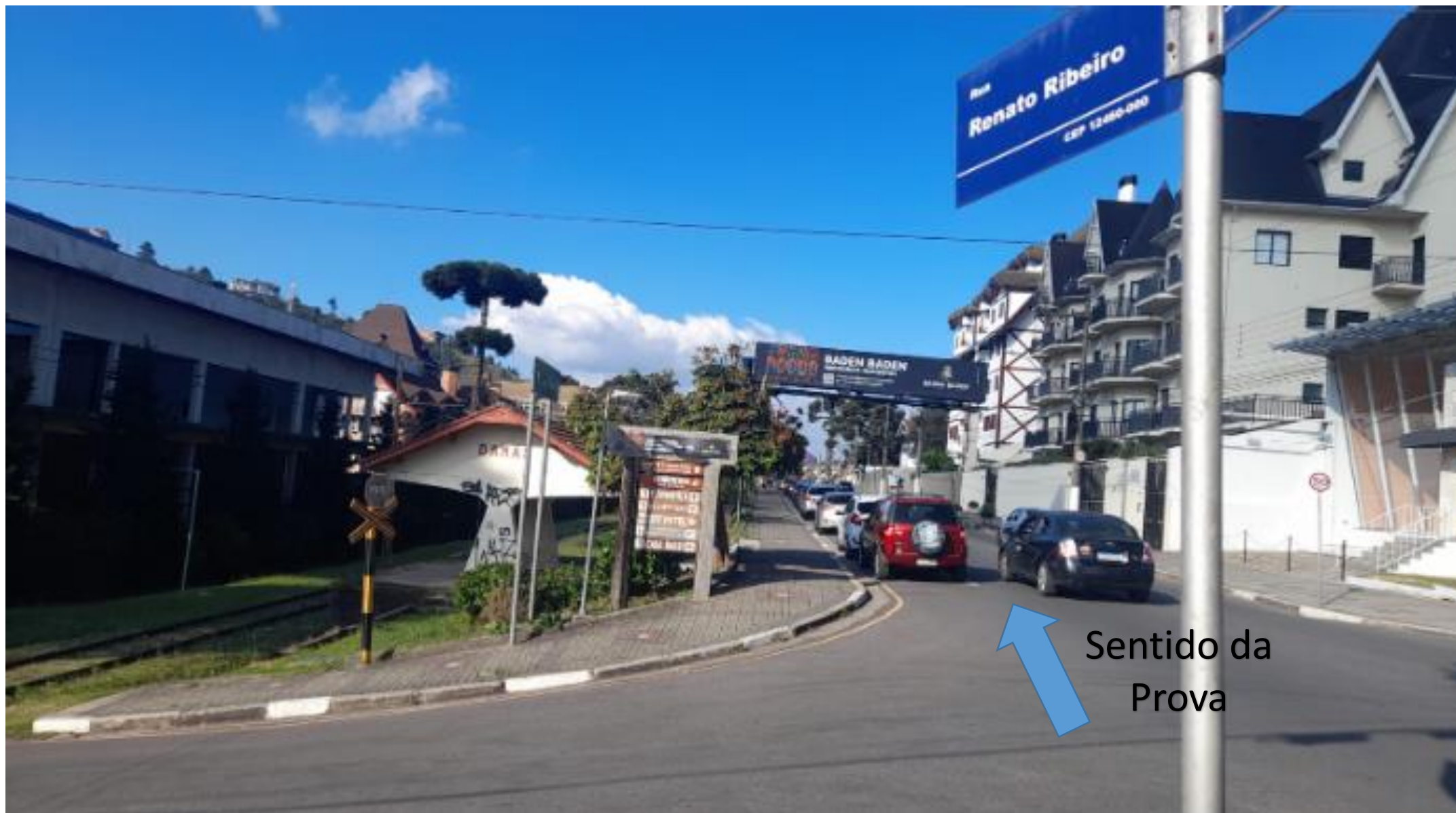
Bifurcação 09: Acesso dos carros à rua Renato Ribeiro (Bombeiros)