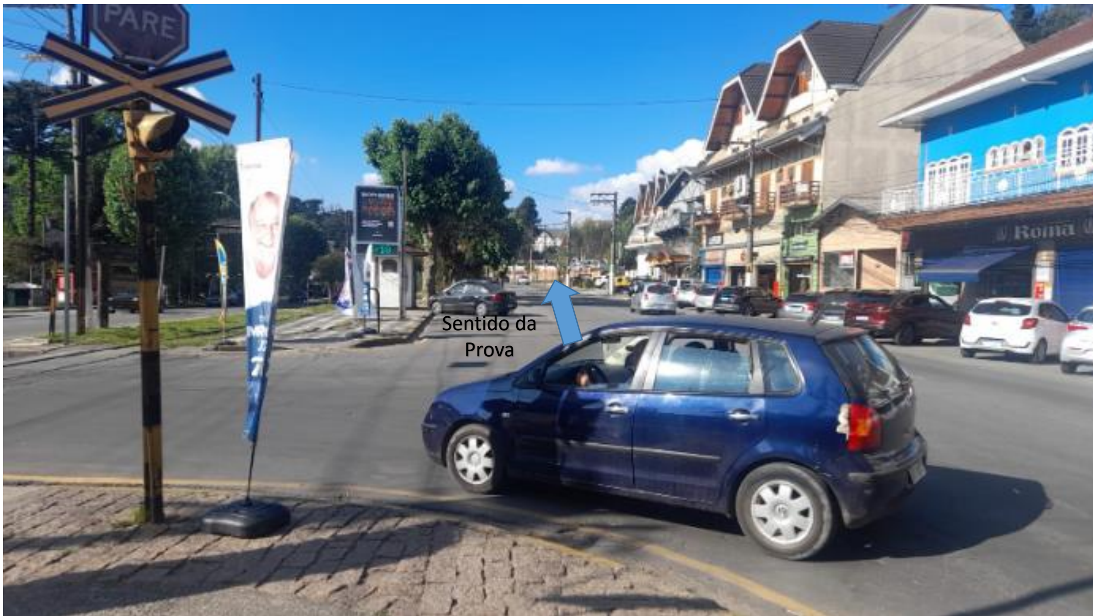
Bifurcação 06: Acesso dos carros à Av. Frei Orestes (Roma)