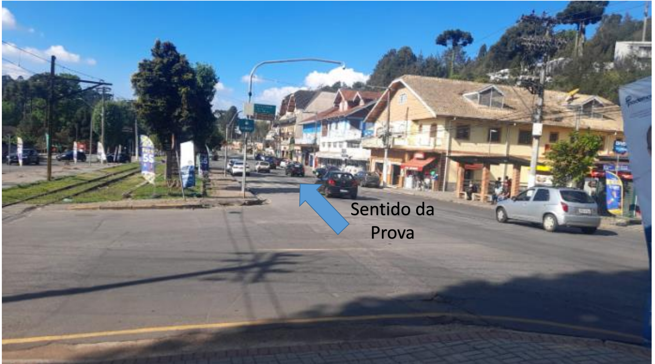
Bifurcação 05: Acesso dos carros à Av. Frei Orestes (Ponto de ônibus Roma)