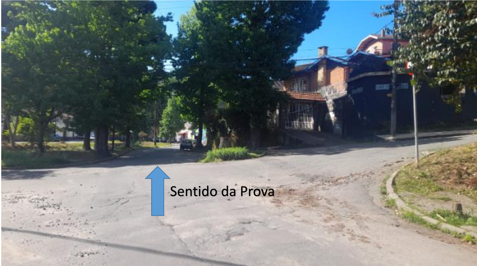
Bifurcação 01: Cruzamento antes do acesso à Avenida Januário Miráglia