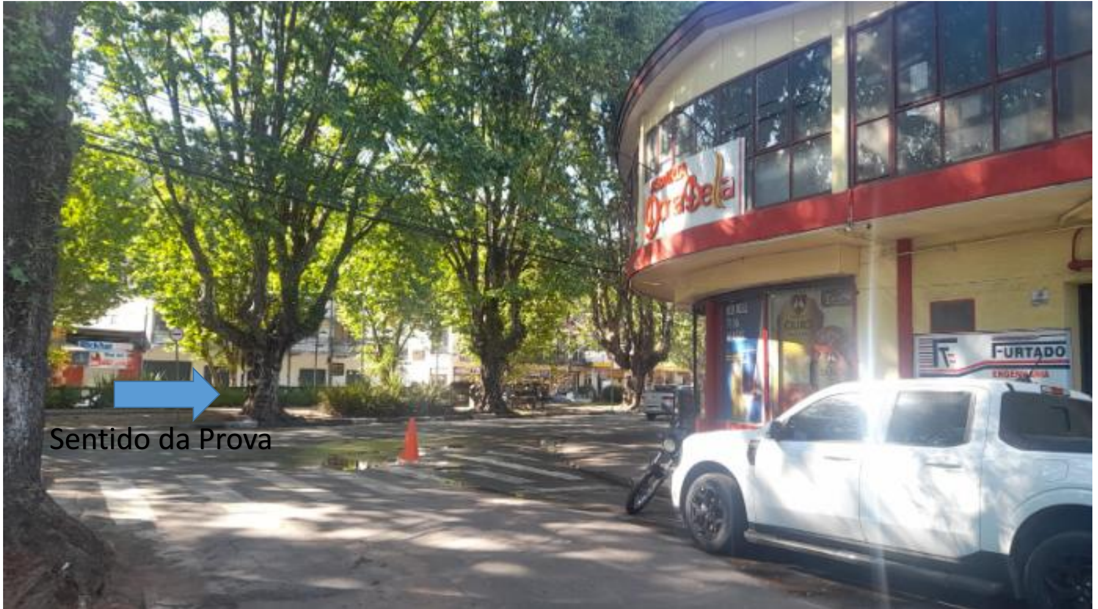
Bifurcação 02: Acesso à Avenida Januário (Dona Bella)