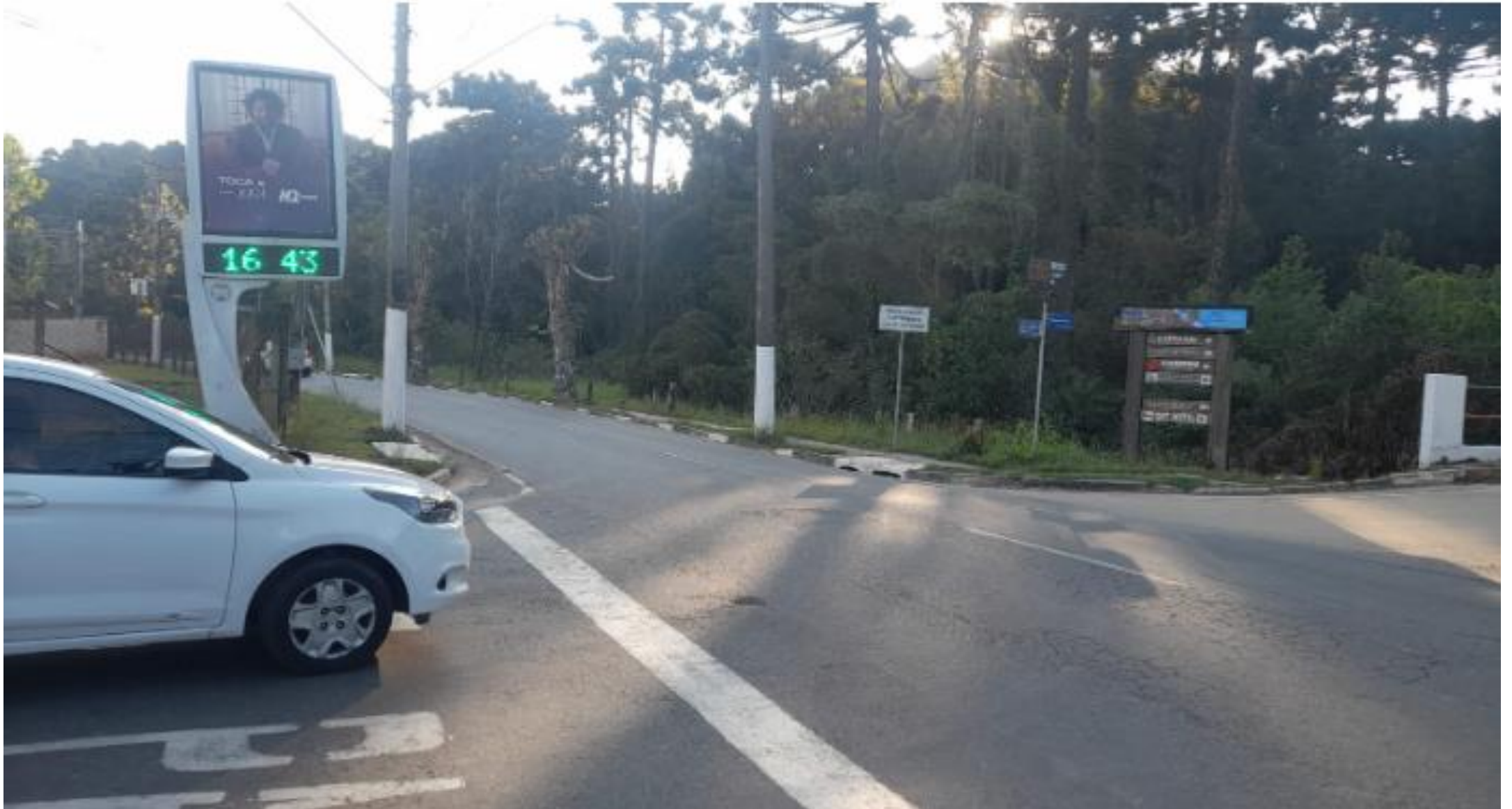
Bifurcação 15: Acesso de Carros à Avenida Frei Orestes (Delegacia)