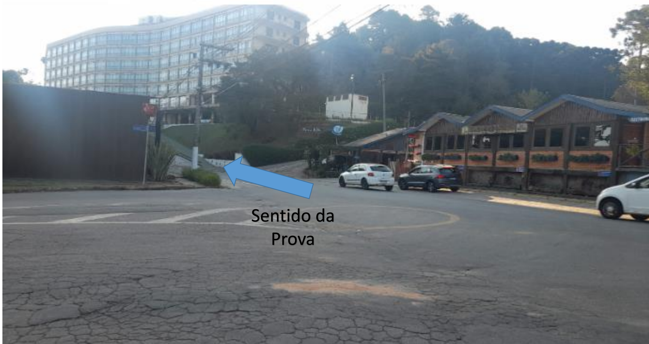
Bifurcação 14: Rotatória Tio Lé