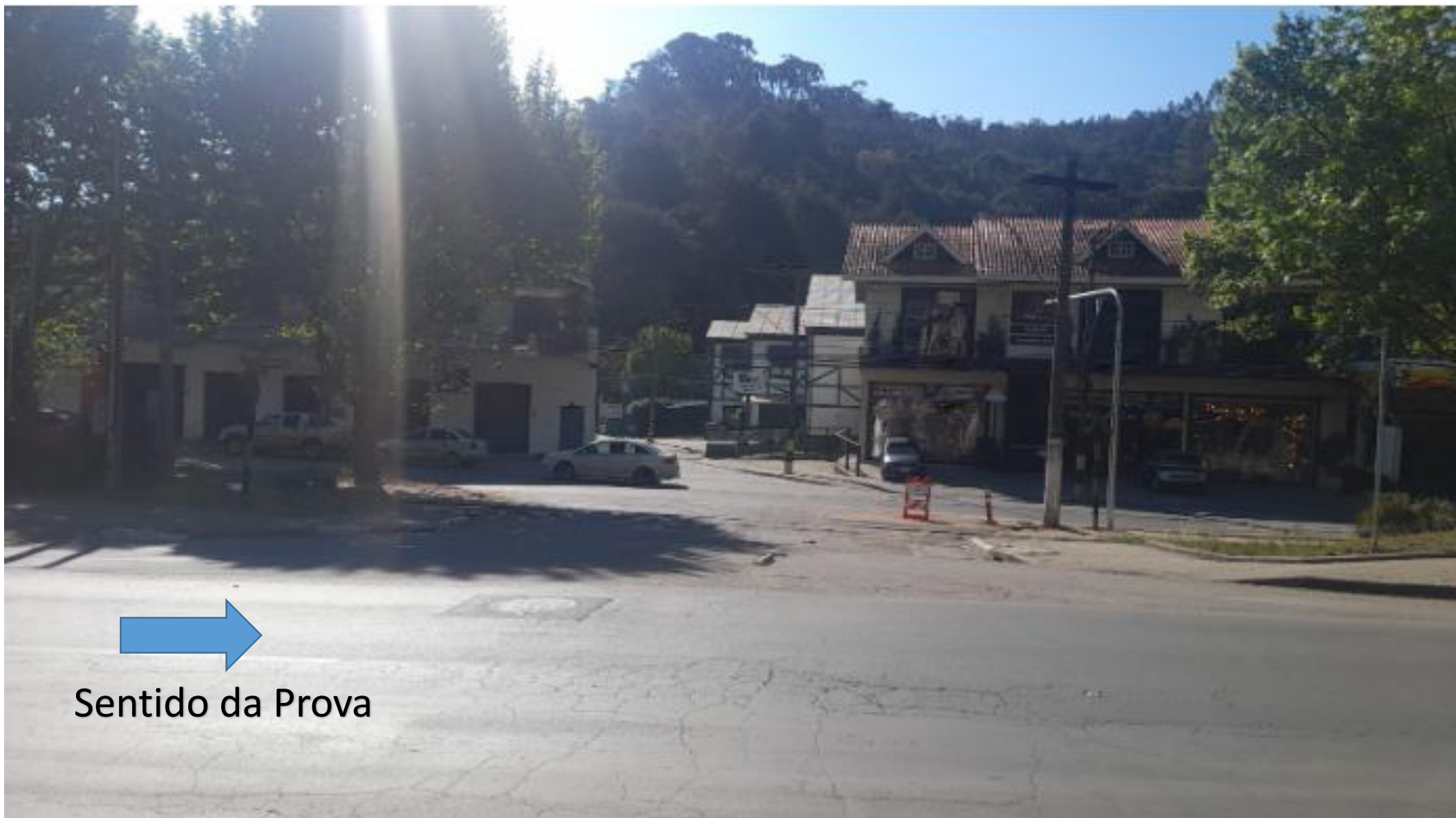
Bifurcação 03: Acesso dos carros à Avenida Frei Orestes (Meta Iluminação)