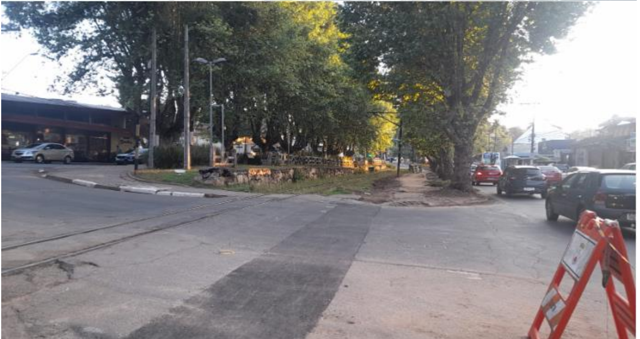
Bifurcação 16: Acesso dos Atletas à Avenida Januário (Dona Bella) PONTO CRÍTICO