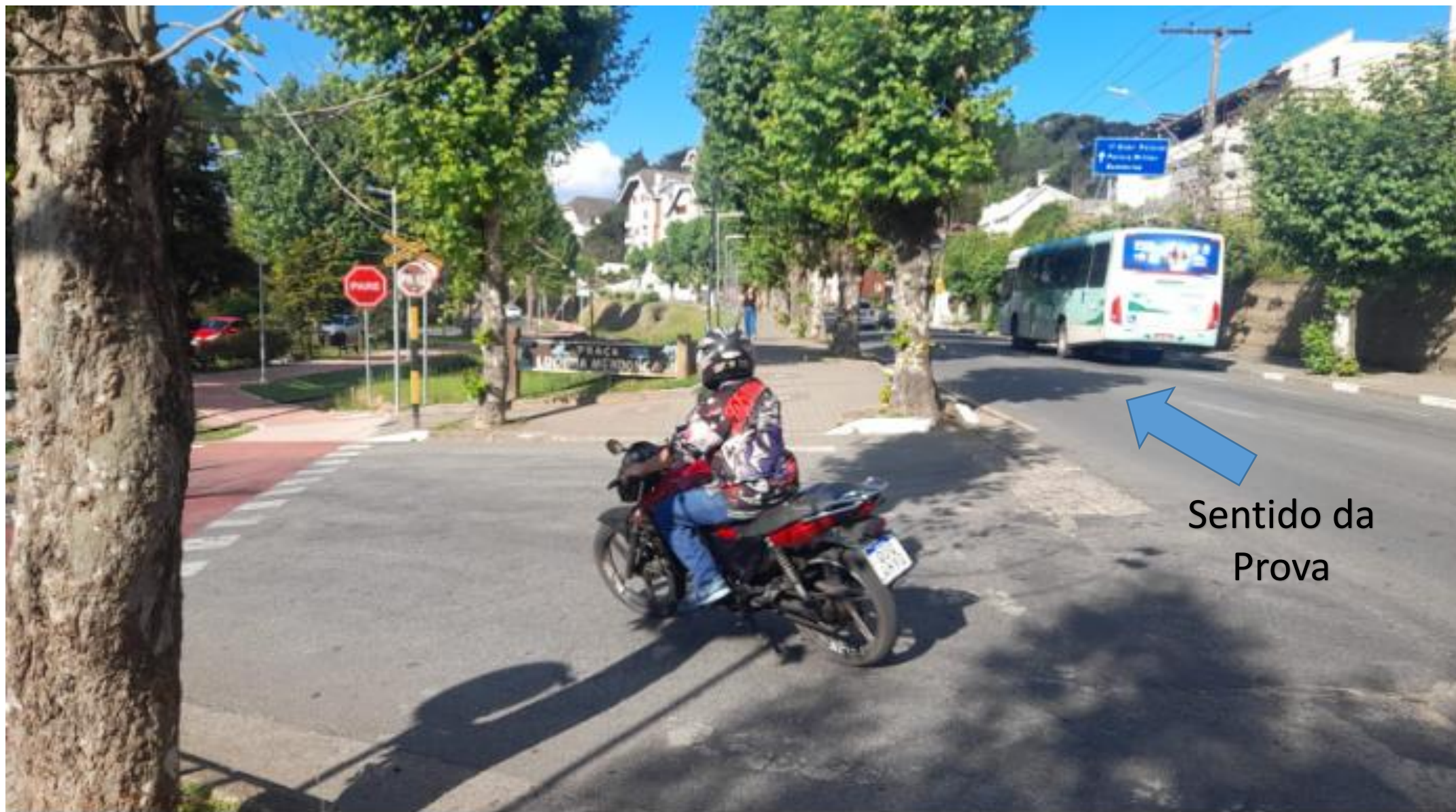
Bifurcação 08: Acesso dos carros à Avenida Frei Orestes (Praça Lucinha Mendonça / Senac)