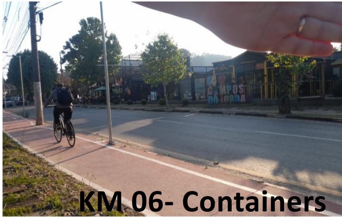
KM 06- Containers