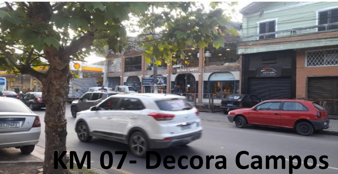
KM 07- Decora Campos