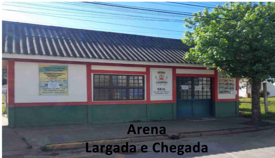
Arena Largada e Chegada