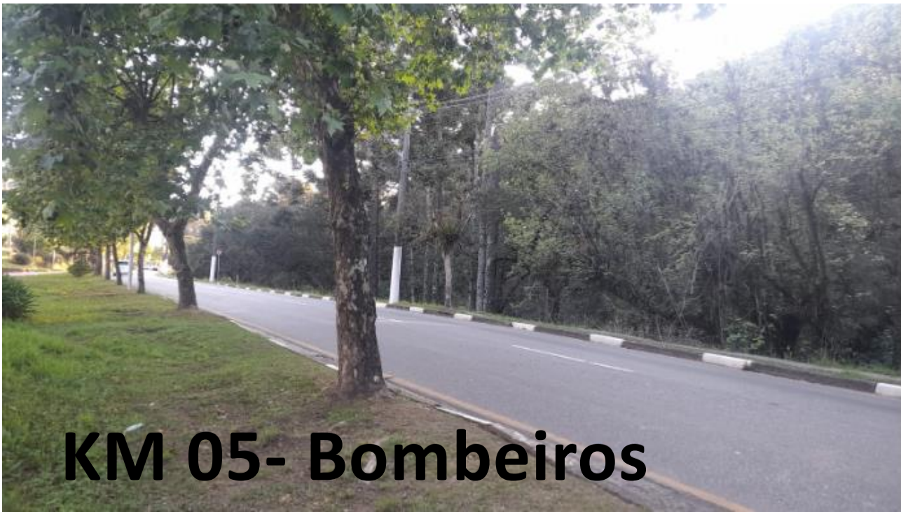
KM 05- Bombeiros