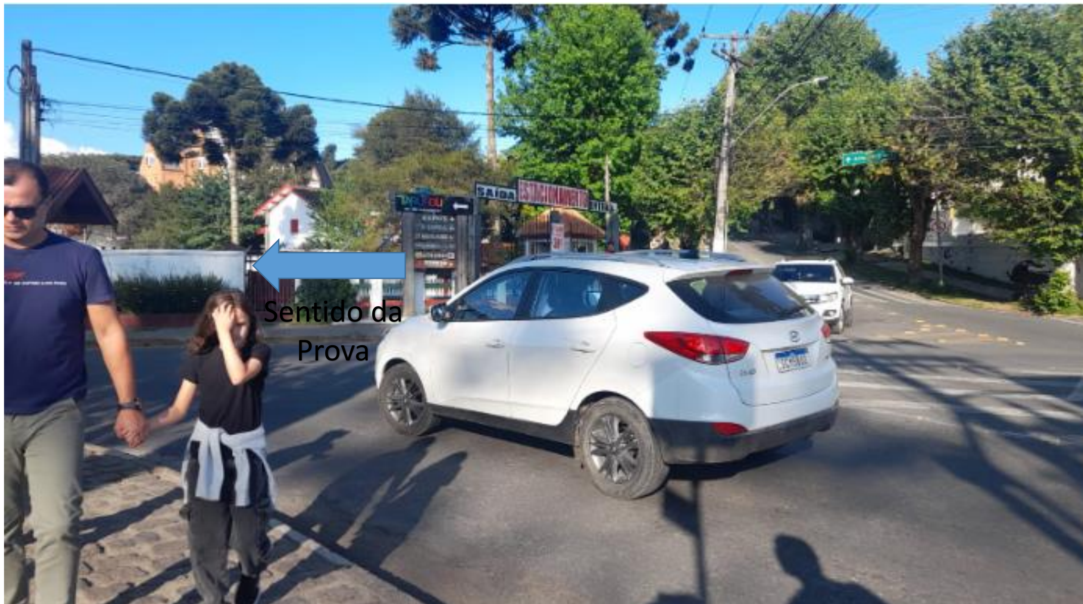
Bifurcação 12: Retorno para Avenida Frei Orestes (Trenzinho II)